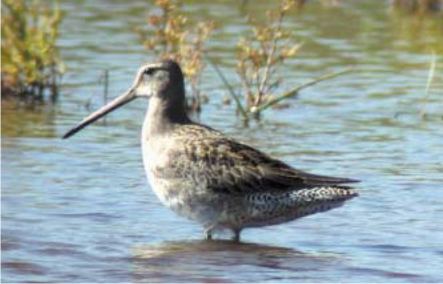
Foto 1. Long-billed Dowitcher, Limnodromus scolopaceus , seen in the Parc Natural de s'Albufera de Mallorca, October 2002.