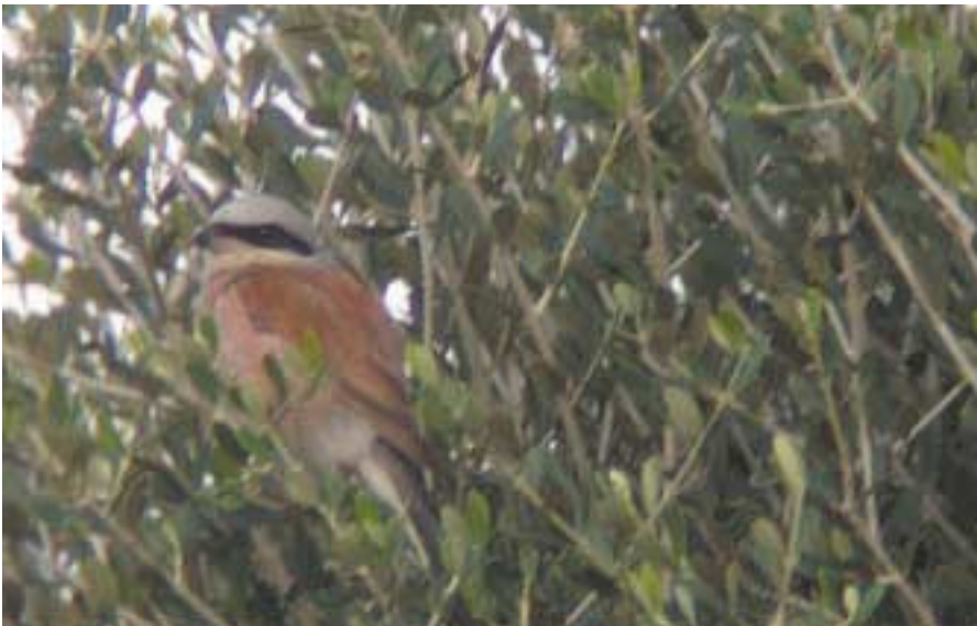
Foto 4. Capsigrany d'esquena roja Lanius collurio (Red-backed Shrike). Cap de ses Salines (Santanyi, Mallorca), mascle adult, octubre 2002.