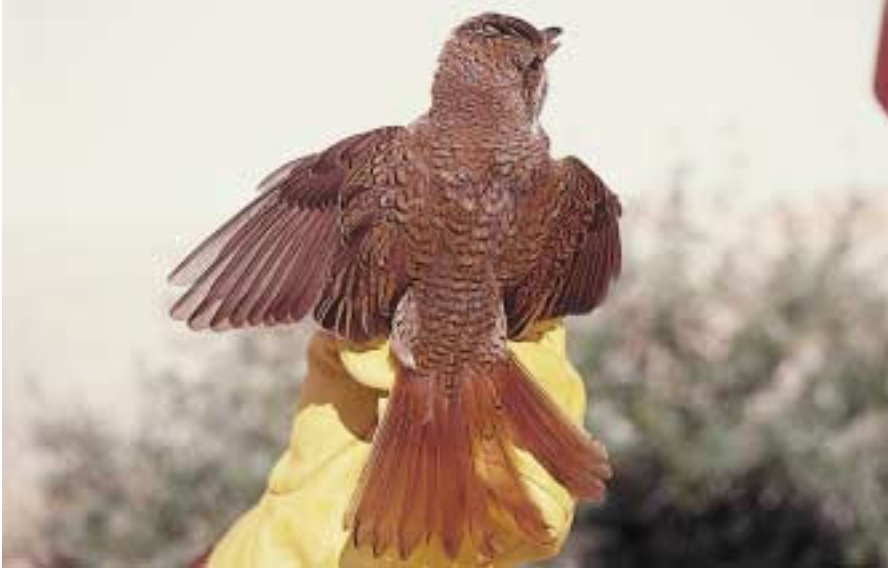
Foto 5. Capsigrany d'esquena roja Lanius collurio (Red-backed Shrike). Cabrera, jove, setembre 2001.