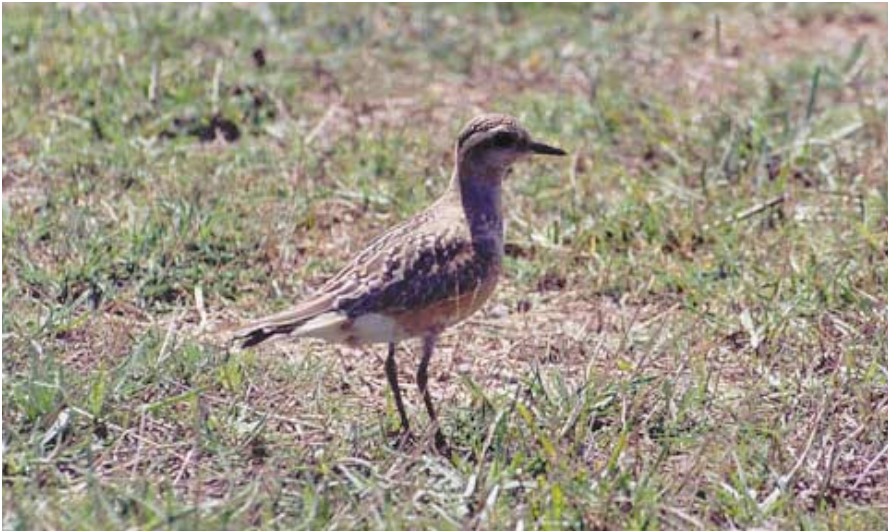
Foto 2. Fuell de collar Charadrius morinellus (Dotterel). Aeroport des Codolar (Sant Josep. Eivissa), setembre 2002.