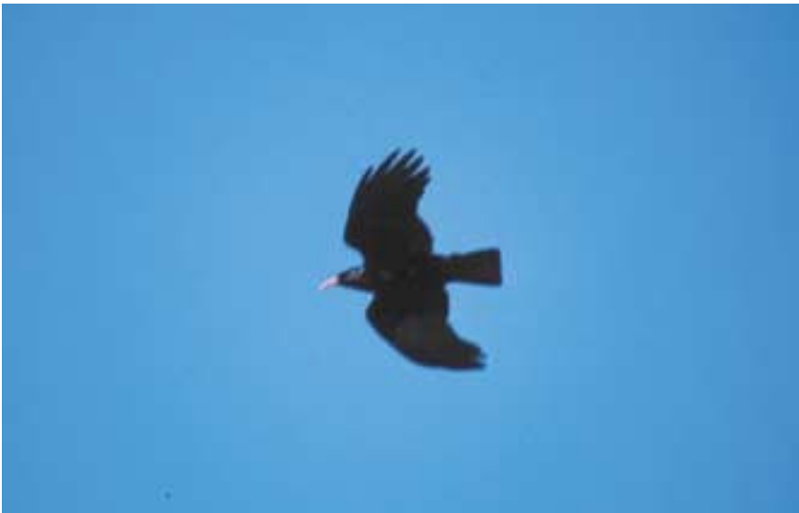
Foto 6. Gralla de bec vermell Pyrrhocorax pyrrhocorax (Chough). Puig de Massanella (Escorca, Mallorca), març 2002.