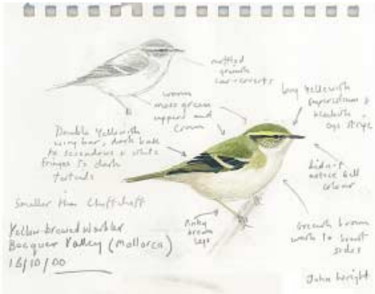
Dibuix 1. Ull de bou de dues retxes Phylloscopus inornatus (Yellow-browed Warbler). Vall de Bóquer (Pollença, Mallorca), octubre 2000. Dibuix: John Wright.