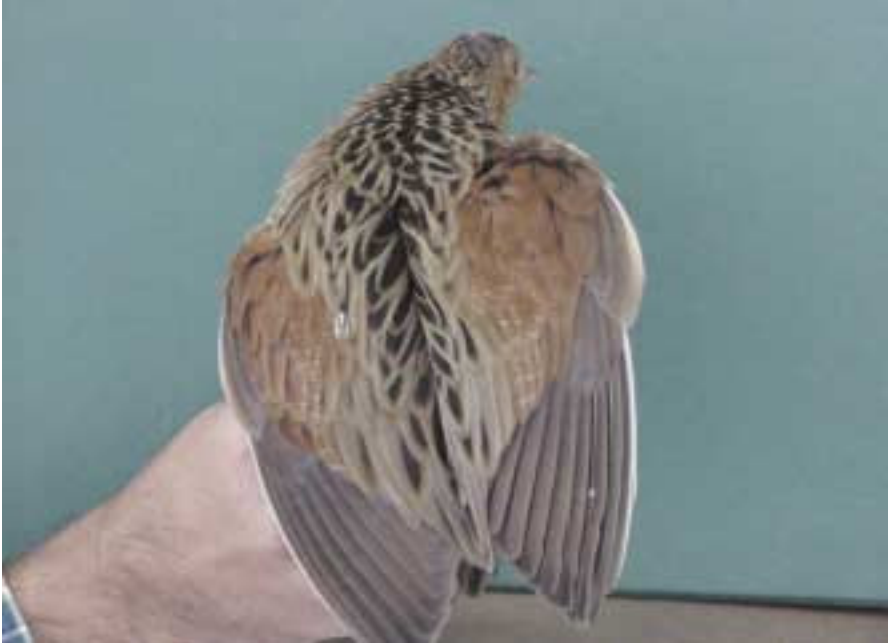
Foto 1. Guàtlera maresa Crex crex (Corncrake). Son Mora (Porreres. Mallorca), octubre 2002.