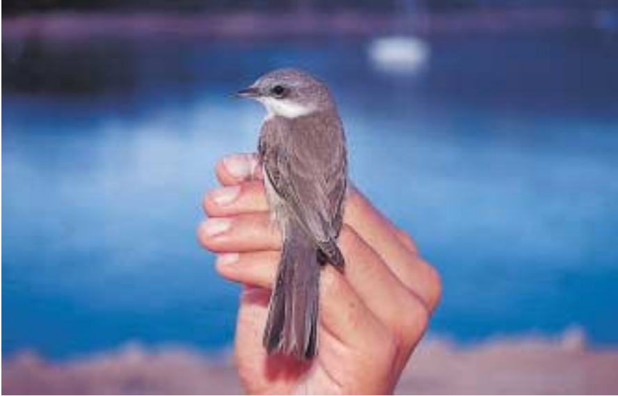
Foto 3. Busqueret xerraire Sylvia curruca (Lesser Whitethroat). Cabrera, juvenil, setembre 2001.