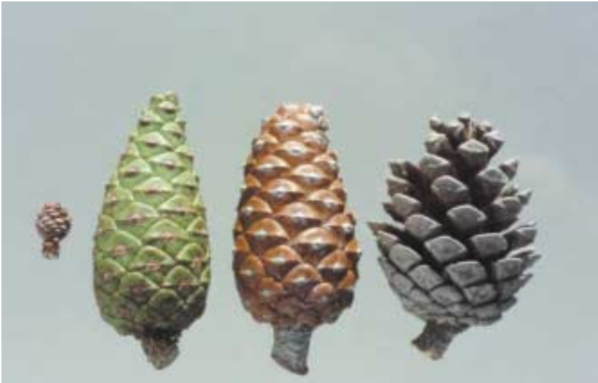
Photo 2. Different cohorts of Aleppo Pine cones. From left to right: a cone two years prior to seeding, a green cone one year prior to seeding, a brown cone in the year of seeding and a grey cone after seeding.

en base al seu tamany i color (foto 2). Les pinyes més joves (cohort 1) foren de només 12-14 mm de llarg. Aquestes es desenvolupen en la següent estació de creixement, per formar pinyes verdes completament desenvolupades (cohort 2). En l'any posterior, les pinyes verdes maduren, s'endureixen i es tornen marrons (cohort 3). A l'octubre, la majoria de les pinyes marrons estaven encara tancades, però qualcunes ja s'havien obert ( i.e. les esquames s'havien desferrat) per deixar anar les llavors. La inspecció de dues d'aquestes pinyes revelà que tots els pinyons ja s'havien escampat. Una vegada les pinyes s'han obert completament, es tornen grises i poden ser retingudes a les branques durant molts d'anys (cohort 4 i superiors). El resultat és