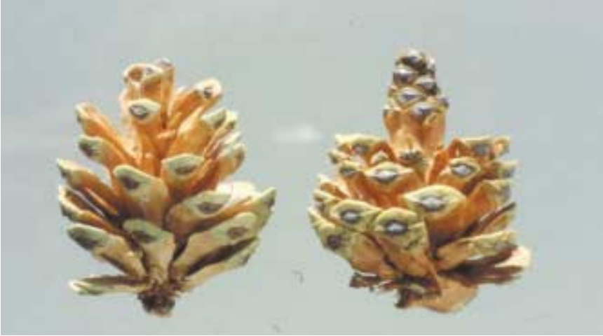
Photo 3. Green cones that had been depredated by crossbills. Left, a typical example with all scales prised back. Right, a cone that has been partially depredated.

Foto 3. Pinyes verdes depredades pels trencapinyons. Esquerra, pinya amb totes les esquames separades. Dreta, pinya parcialment depredada.