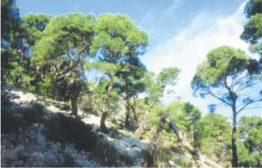
Photo 1. Aleppo Pine forest on the slopes of the study area on Cape Formentor.