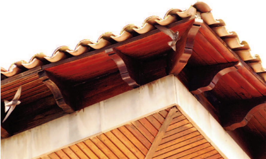
Foto 1. Falzia pàl·lida Apus pallidus nidificant a les teulades d'un edifici d'Inca. Juny de 2010.

Photo 1. Pallid swift Apus pallidus breeding in the roof tiles of a building in Inca. June 2010.