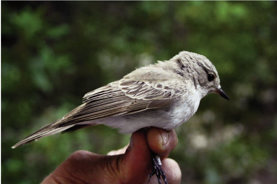
Foto 1. Mascle de menjamosques balear M. s. balearica . 8 de juny de 2012. Anella nº A232484. Es poden observar les característiques de la subsp. balear, amb el pit molt clar i poc marcat i les parts superiors més clares que la subsp. nominal. Photo 1. Male of Balearic spotted flycatcher M. s. balearica , 8th June 2012. Ring number A232484. Note the poorly marked chest, clearer and lighter upperparts than nominate subsp. striata .