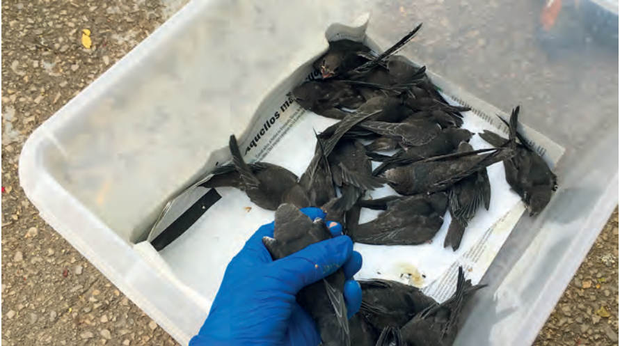
Foto 1. Acumulació de polls de falzies Apus apus a les instal·lacions del Centre Recuperació de Fauna del COFIB durant els dies crítics de la temporada 2019. Photo 1. Accumulation of Apus apus chicks at the Animal Recovery Centre of COFIB during the critical days of the 2019 season.