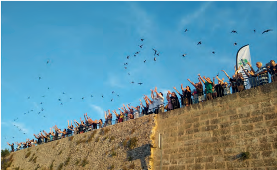
Foto 2. Alliberament de falcies Apus apus al puig de Randa el 18 de juliol de 2019 amb el gran equip de voluntariat.

Photo 2. Release of Apus apus swifts at puig de Randa on July 18, 2019 by the great team of volunteers.