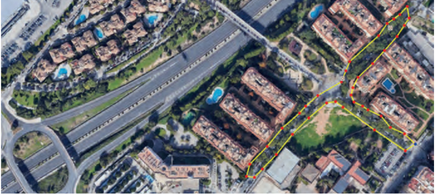
Figura 3.- Alineacions de tipuanes a la Zona B (Son Cotoner): carrers Juan Gris i Francesc Martí Mora. Maps Data: Google, Image ©2021 Maxar Technologies (Dates de les imatges 20/02/2021).