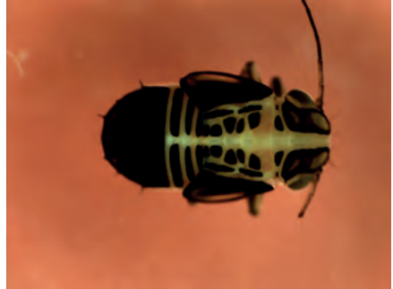
Foto 2 i 3. Vista lateral d'adult i ninfa de Platycorypha nigrivirga capturats a la zona de l'observació. Photo 2 and 3. Lateral view of an adult (left) and nymph (right) of Platycorypha nigrivirga captured in the observation area.

tant les aus que volaven a baixa altura, com les que volaven en altura, estaven aprofitant algun tipus de plàncton aeri o insectes de mida petita. Es va inspeccionar la part baixa de les alineacions d'arbres de tipuana de la zona del carrer Sevilla (Son Cotoner). Baix dels arbres hi havia una catifa de flors madures caigudes. Es va recollir una mostra de flors i es varen poder aïllar de dins de les flors exemplars adults i nimfes d'un hemípter psíl·lid que posteriorment es va identificar com a Platycorypha nigrivirga Burckhardt, 1987 (Hemiptera: Sternorrhyna: Psylloidea: Psyllidae). Les flors de tipuana estaven patint atacs d'herbivoria, rosegades per insectes en el cas que ens ocupa, per les nimfes de P. nigrivirga (Foto 1, 2 i 3). Es va poder veure clarament com les falzies no s'alimentaven a les zones arbrades amb presència de mèlies Melia azedarach o de falses acàcies Robinia pseudoacacia , doncs aquestes espècies, tot i estar sembrades pròximes no presentaven les infestacions del psíl·lid.