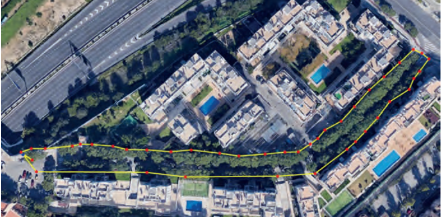
Figura 2. Alineacions de tipuanes a la Zona A (La Puríssima): carrer Sevilla. Maps Data: Google, Image ©2021 Maxar Technologies (Dates de les imatges 20/02/2021).