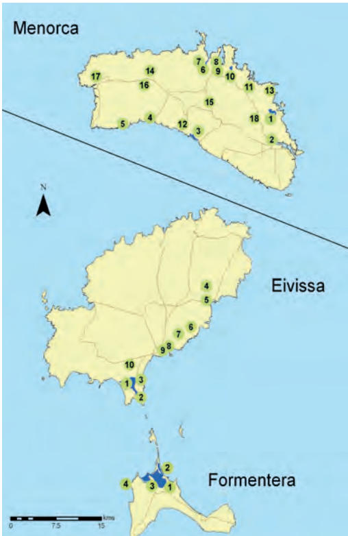
Mapa 2. Situació de les localitats on s'ha realitzat el recompte a Menorca, Eivissa i Formentera el gener de 2021. El nombre es correspon amb la taula 1.

A Formentera s'han censat 4 zones (Mapa 2), dues manco que al cens anterior, on es detectaren un total de 2 espècies, tres espècies més. El nombre d'exemplars censats va ser de 276, el que suposa una davallada de 348 aus respecte a 2020, una baixada d'un 55,77 %. L'espècie més nombrosa ha estat l'esplugabous amb 81 exemplars, seguida del picaplatges camanegre amb 62 exemplars, ambdues espècies amb lleus augments per sobre de l'any anterior. El cens de la cabussonera ha estat de 9 exemplars, una baixada important respecte als 280 exemplars del 2020 i dels 333 el 2019. La segona espècie amb una davallada notable ha estat el fuell daurat amb tan sols 5 individus, uns 75 manco que a 2020.