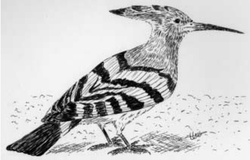
Figura1. Posició de descans del puput Upupa epops . Dibuix: Gemma Carrasco. Figure 1: Hoopoe Upupa epops in a rest position.