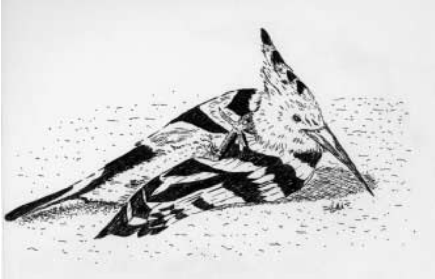
Figura 3. Puput Upupa epops , gratant-se el cap amb la pota entre el flanc i l'ala, després de restar una estona amb les ales esteses i la nuca sobre el mantell. Dibuix: Gemma Carrasco. Figure 3. Hoopoe Upupa epops scratching its head after resting with an open wing and neck over the mantle posture.

La presència d'altres espècies d'auccells no sembla que afectés l'activitat del puput, només en una de les observacions el puput va ser atacat per avisadors, però només quan aquest s'acostava massa als seus nius, per tant les postures del puput no es poden considerar una reacció davant aquesta espècie. En cap de les dues ocasions s'observà la presència de possibles depredadors als voltants o volant sobre la zona. Per tant no pareix lògic pensar en una postura encaminada a la cripsi o contra depredadors. Tal com apunten FRY et alt. (1993) aquestes postures s'haurien d'interpretar més com un bany de sol que com una acció contra depredadors. L'animal realitzava el ritual de forma tranquil·la i sense semblar alterat. Manuel M. Vivaldi afirma haver observat qualche vegada