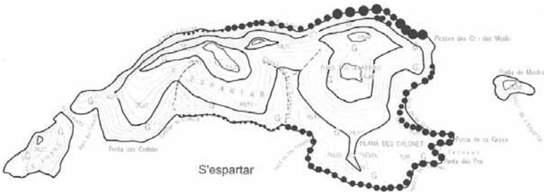
Densidad relativa de Hydrobates pelagicus melitensis

Map 1: Situation of the nuclei of Hydrobates pelagicus on the islet of s'Espartar.