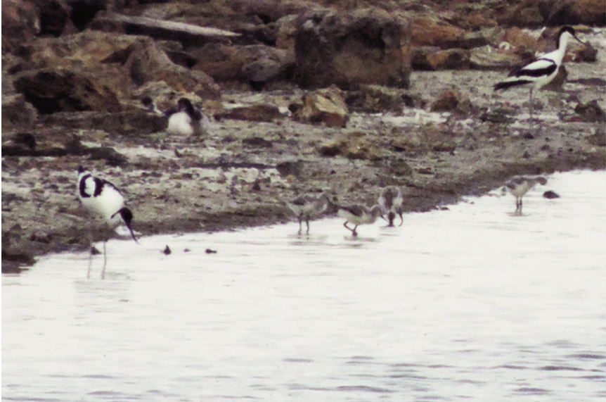
Foto 1. Bec d'alena Recurvirostra avosetta adults amb polls, estany Pudent, Formentera, juny de 2013.