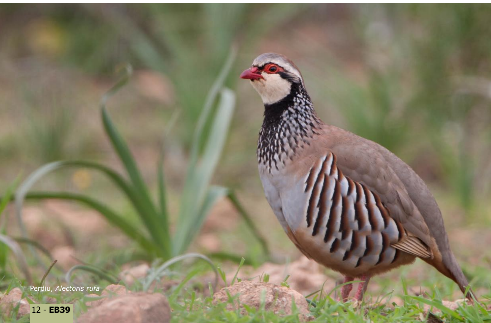
Perdiu, Alectoris rufa

Cal posar-hi un poc de racionalitat, i modificar el marc legal per tal de permetre la caça només als vedats, on es tengui el vistiplau dels propietaris.